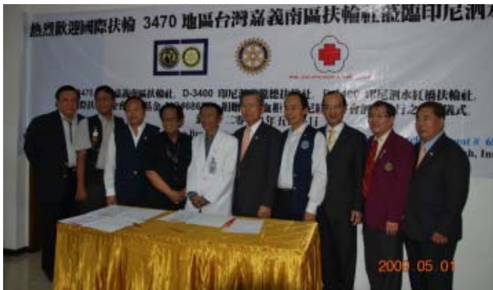
泗水紅十字會血液冷藏櫃捐贈儀式

call，前往觀日出。Bromo 山的海拔與阿里山差不多，清晨氣溫極低。我們搭吉普車在黑暗中